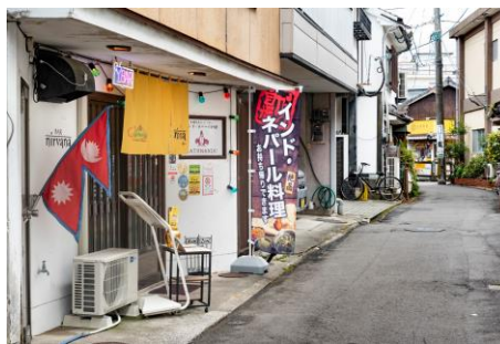
路地に漂う異国情緒も、今ではおなじみの風景に。