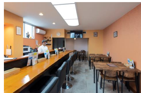
居酒屋「バッティーバラット」。いろいろな国の料理が楽しめる。