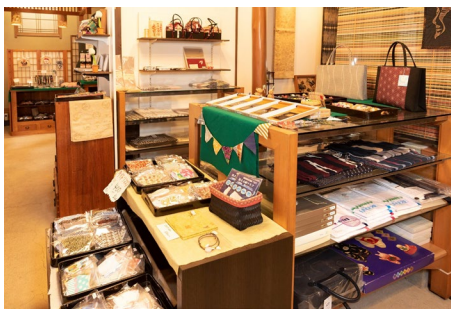
店內還擺滿了各式各樣的和服配飾。