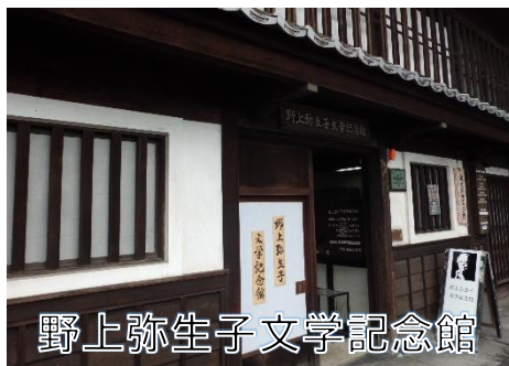
野上弥生子文学記念館