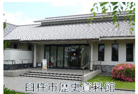
白杵市歴史資料館