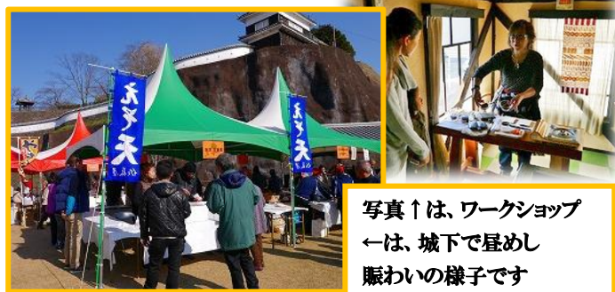
写真↑は、ワークショップ ←は、城下で昼めし賑わいの様子です

白杵産の有機野菜や海産物を使ったメニューを手ごろに食べられ、有機野菜や加工品の購入が出来る他、今年は白杵市の有機農業の取り組みを描いたドキュメンタリー映画「100年ごはん」の上映会や大林千景監督を講師に迎え、ほんまもん農産物と地魚を具にしたホットサンド作りのワークショップなど、各会場で賑わいを見せていました。