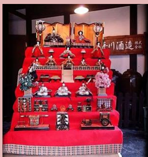
←段飾りのお雛様がきれい